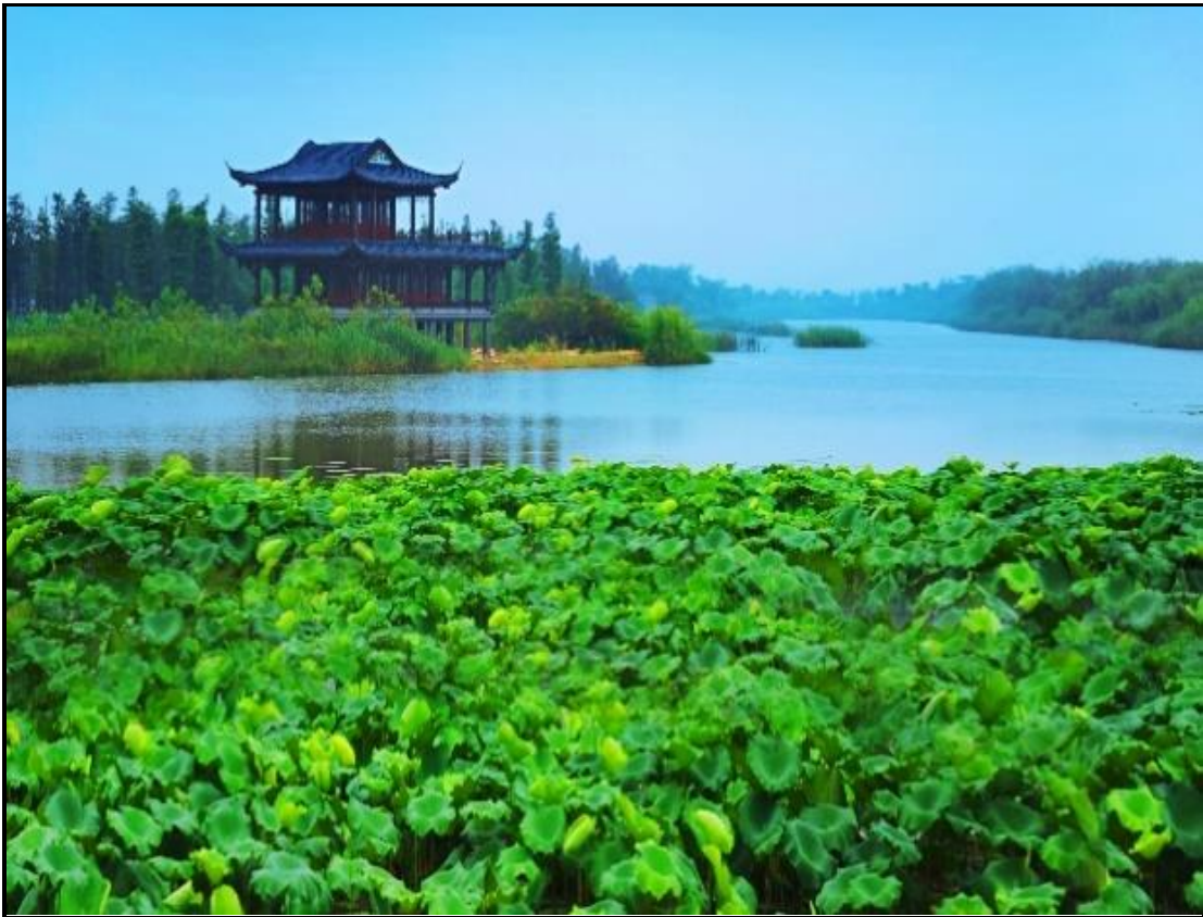
潘安湖生态修复后