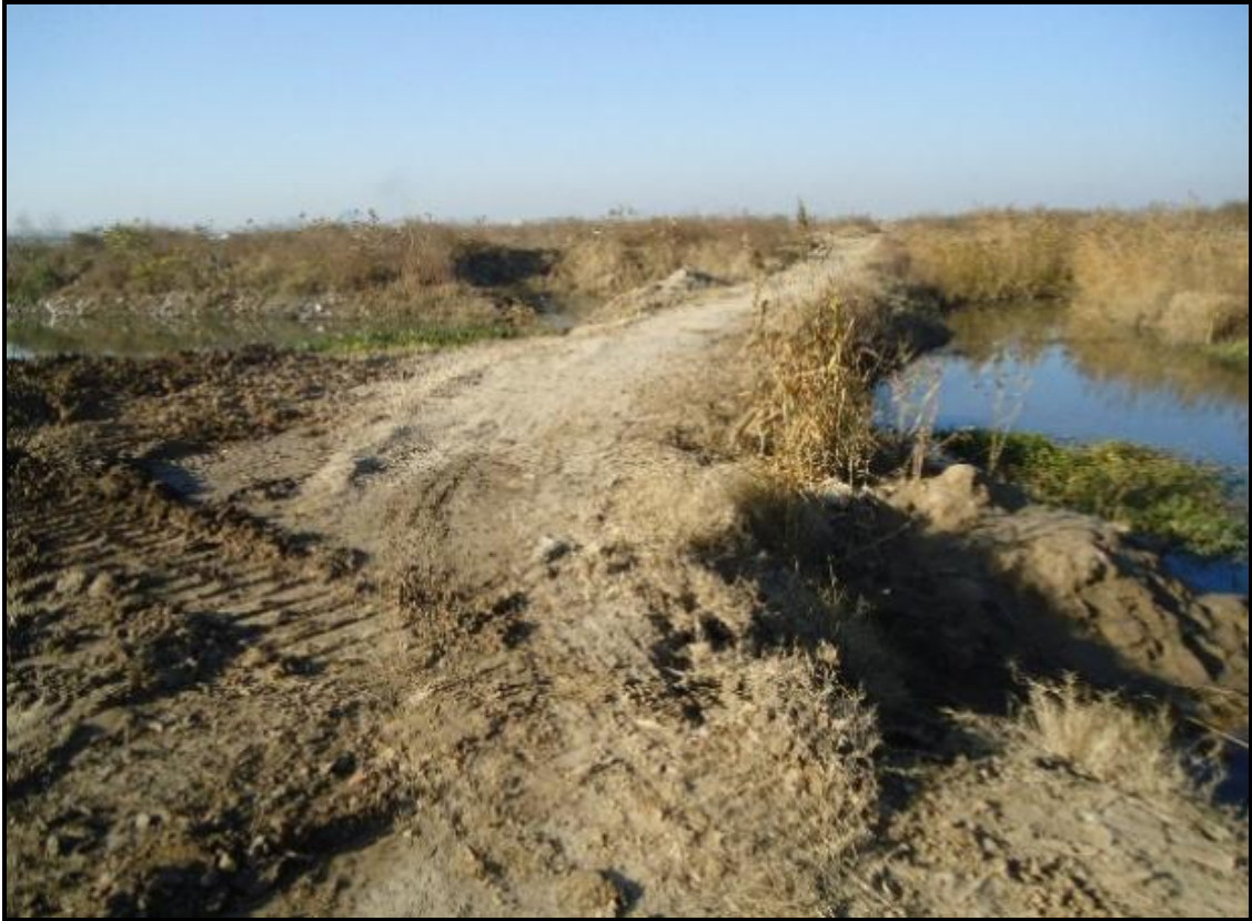
潘安湖生态修复前